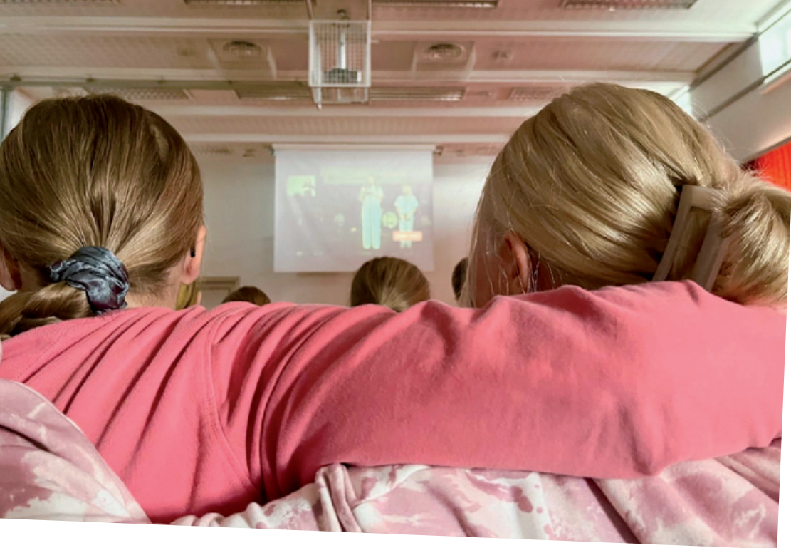
Sauvosaaren koulun oppilaat Ylivieskan striimiä katsomassa.