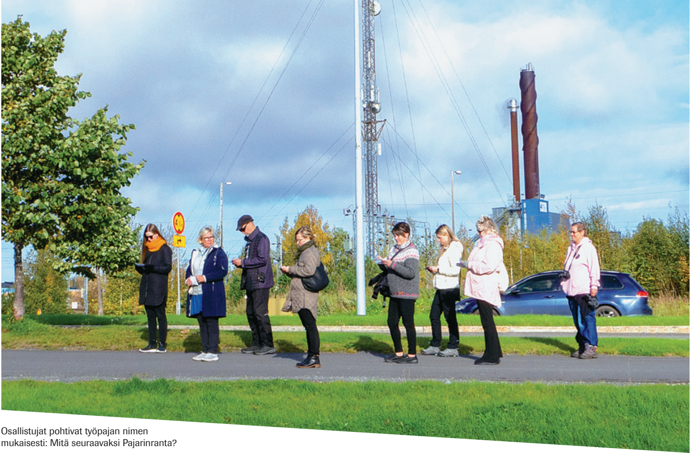
Osallistujat pohtivat työpajan nimen mukaisesti: Mitä seuraavaksi Pajarinranta?