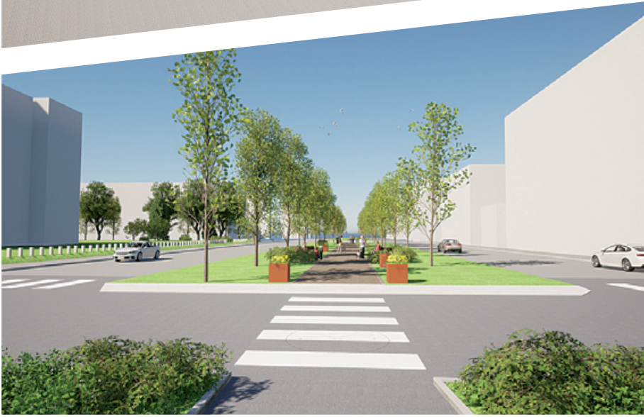
Luonnoskuvat Kemian rautatieaseman pysäköintialueen (yllä) sekä Kirkkopuistokadun ja Keskuspuistokadun (alla) kehittämistä.