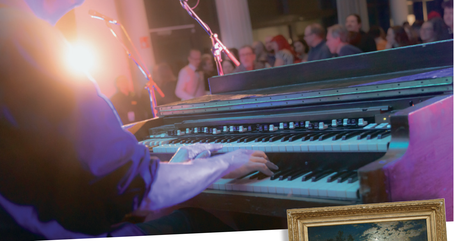
Pakkasukko Blues N' Jazz LumiLinnalla, 2023.