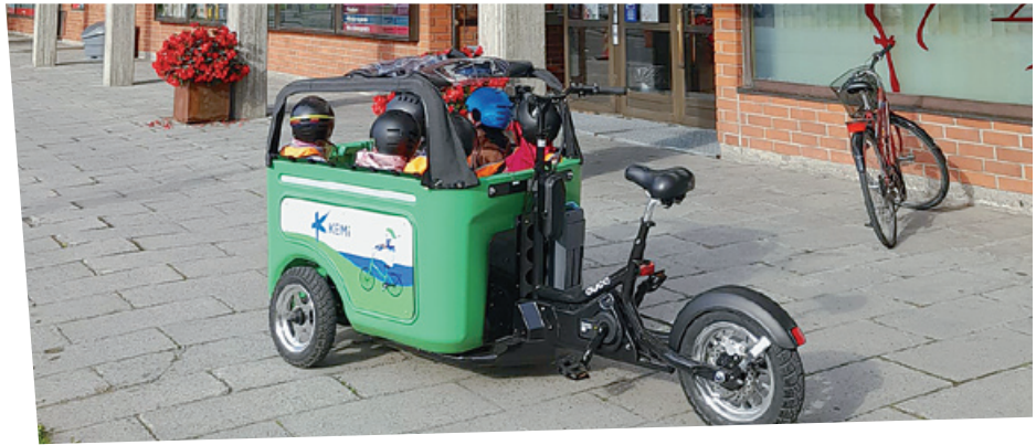
Pajarinrannan päiväkodin lapsia muksubussiretkellä kulttuurikeskuksen edustalla.