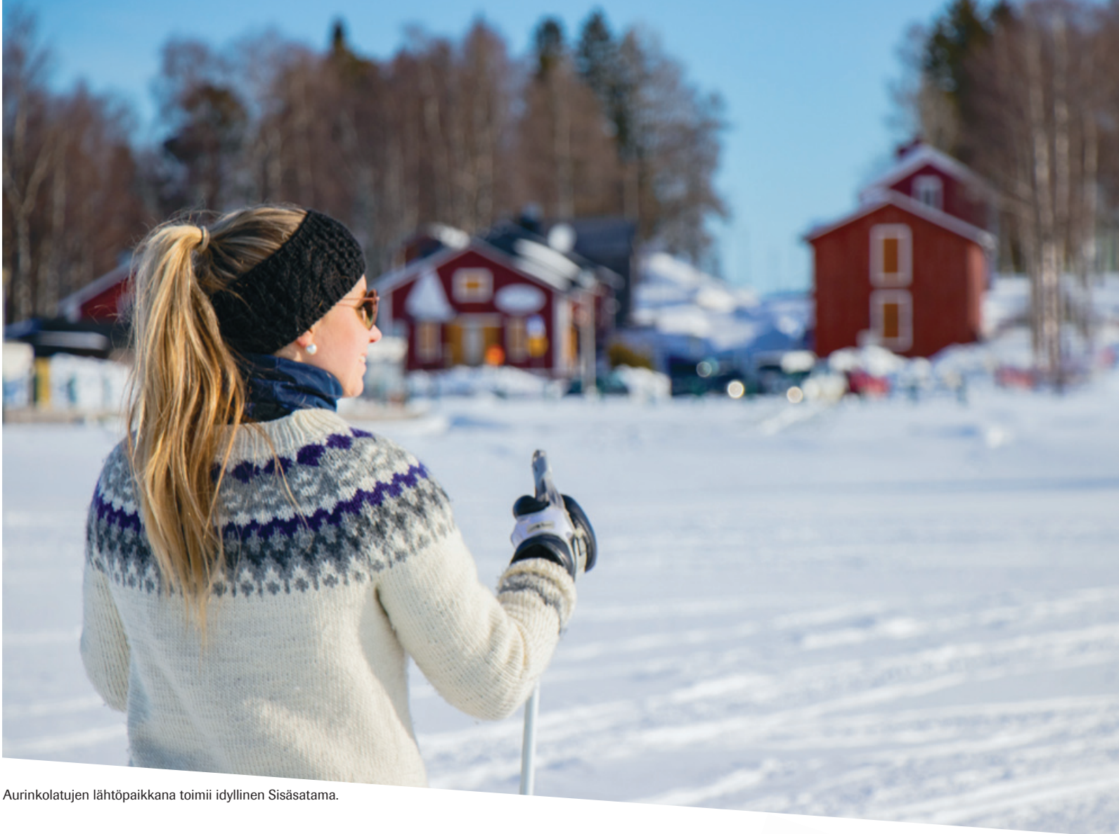
Aurinkolatujen lähtöpaikkana toimii idyllinen Sisäsatama.