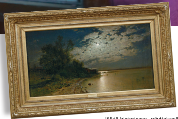
Jälkiä historiassa -näyttelyssä on esillä mm. maisemataiteemme mestarin Hjalmar Munsterhjelmin Kuutamoyö 1800-luvun lopulta.