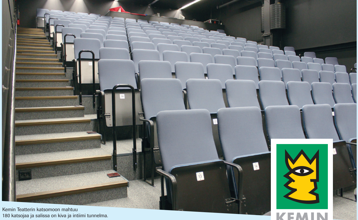
Kemin Teatterin katsomoon mahtuu 180 katsojaa ja salissa on kiva ja intiimi tunnelma.